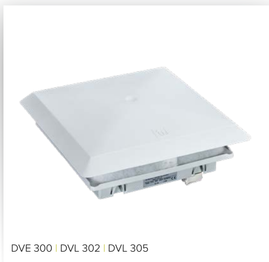
DVE 300 | DVL 302 | DVL 305