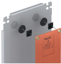
Montage auf einer glatten Montageplatte mit Klettband