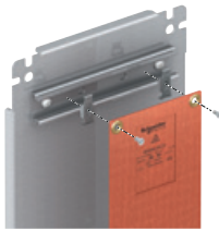
Montage auf einer DIN Schiene