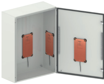
Montage an Türen oder Wänden (von Schaltschränken) mit Klettband